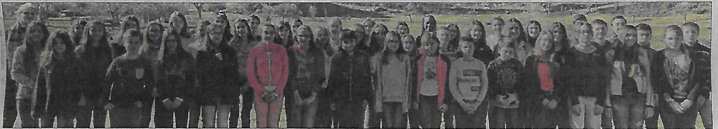
La chorale du collège Robert-Schuman en répétition au centre du Torrent de Storckensohn.

La cinquantaine d'élèves de la chorale du collège Robert-Schuman sera sur la scène du Cap, à Saint-Amarin, ce vendredi soir à 20 h.